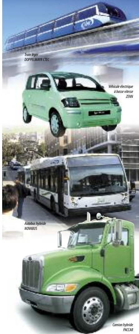
Train léger DOPPELMAYR CTEC

Par TRANSPORT TERRESTRE AVANCÉ, on entend tout le secteur économique qui comprend les produits finis, les composantes et les procédés de fabrication de véhicules légers ou lourds à la fine pointe de la technologie en ce qui a trait aux modes de propulsion, à l'efficacité énergétique, à la sécurité, à la résistance, au poids et à l'impact positif sur l'environnement.